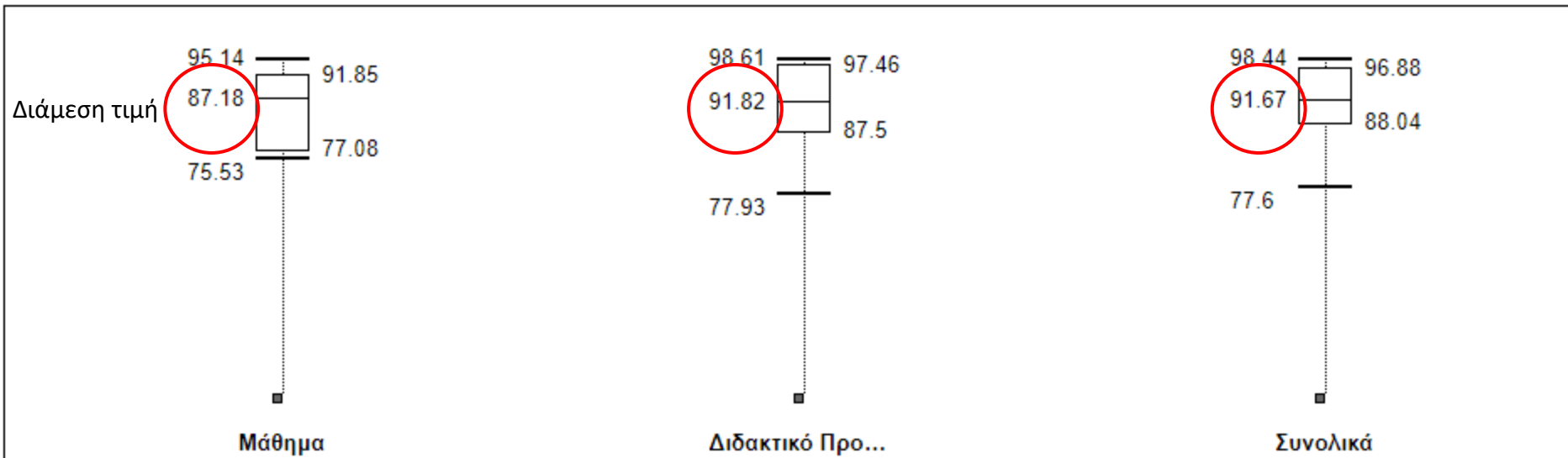
Θηκογράμματα αποτελεσμάτων ανά ενότητα ερωτήσεων